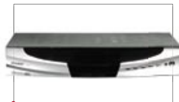
СПУТНИКОВЫЙ ТЮНЕР Openbox – своеобразное окно в мир. Кроме высококачественных выходов имеет жесткий диск объемом памяти 160 Гб