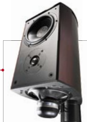
ФРОНТАЛЬНЫЕ АС Wilson Benesch Discovery, несмотря на компактные габариты, способны обеспечить превосходные басы и необычайную прозрачность звучания

плекту АС Wilson Benesch (Discovery/Centre/ARC). В качестве источника использован DVD-проигрыватель Marantz DV-9600. Поначалу кабели закладывались под 7.1, но затем Сергей передумал, так как видеодисков подобного формата нет, и решил: пусть лучше будет 5.1., хотя выведенные разъемы для подключения дополнительных АС остались. Что касается сабвуфера, то кабели для его подсоединения были проложены. Однако Wilson Benesch Discovery, несмотря на свои компактные габариты, очень хорошо прорабатывают НЧ-спектр, и когда все настроили и включили, хозяин, внимательно послушав, посчитал, что сабвуфер не нужен. Даже несмотря на то, что режим 5.1 подразумевает наличие дорожки НЧ-эффектов, записанной на DVD-диске, ресивер Marantz SR-9600 умеет посылать соответствующие