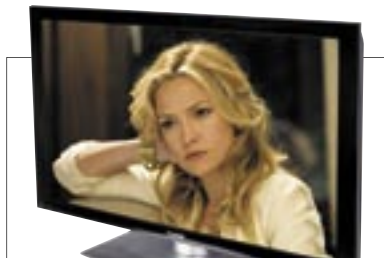
ПЛАЗМЕННАЯ ПАНЕЛЬ Pioneer PDP 507 XD отлично справляется как с DVD-записями, так и эфирными программами. Установлен на специально разработанной стойке Plastun