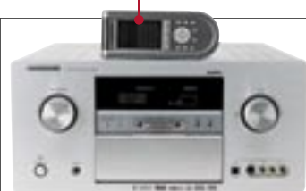
AV-РЕСИВЕР Сердцем комплекта является Marantz SR-9600, обеспечивающий 140 Вт на каждый из семи каналов, что позволяет озвучить достаточно большое помещение