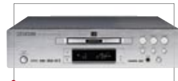
DVD-ПРОИГРЫВАТЕЛЬ Marantz DV-9600 не только способен качественно воспроизводить DVD-диски, но также довольно музыкален (включая SACD)